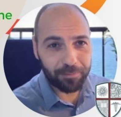
C.E.O. StrokeTherapy REVOLUTION